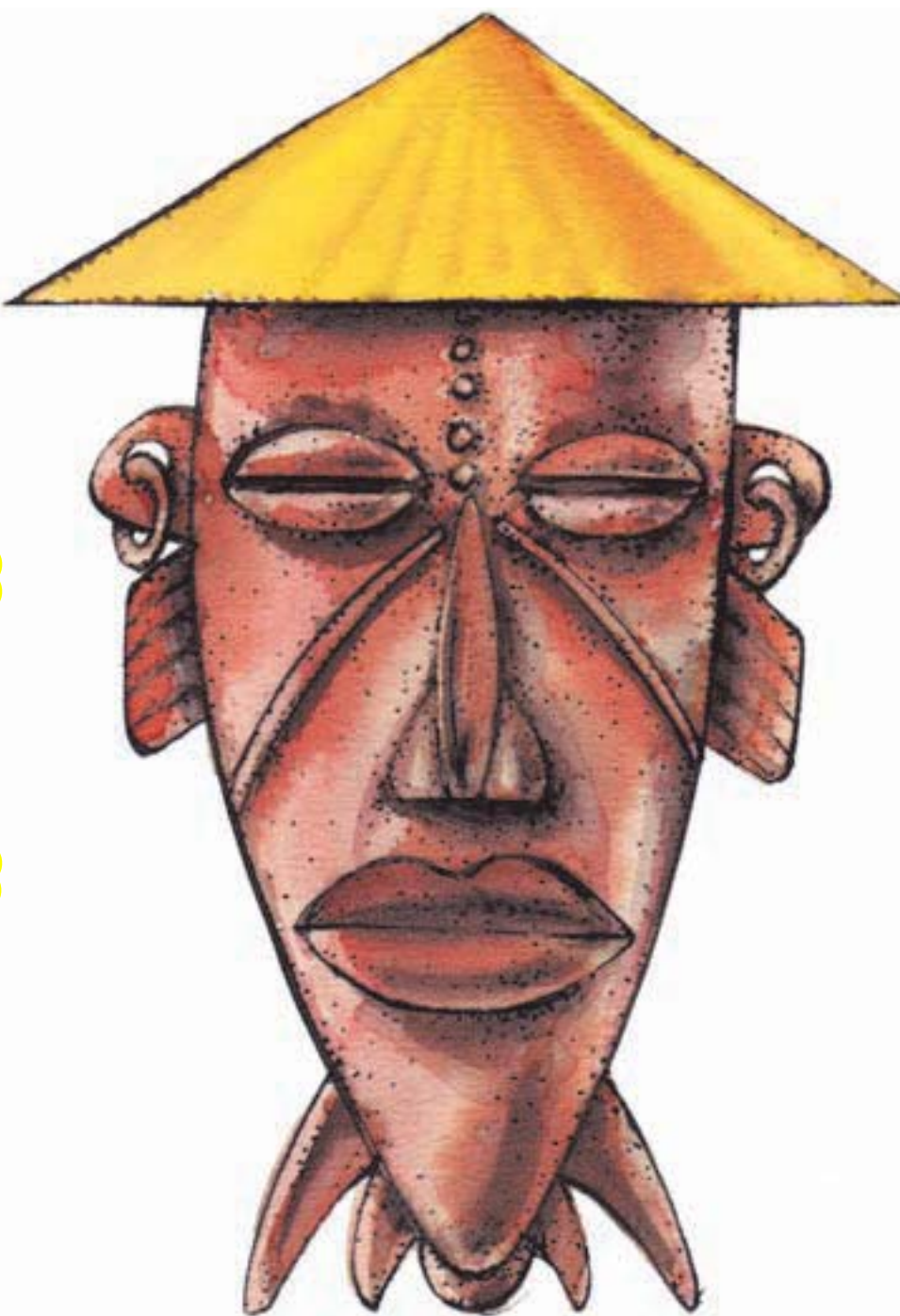
↑ Dessin de Vlahovic, Serbie.

Alors que la France semble de plus en plus se désengager dans maints secteurs, la Chine ne fait qu'intensifier sa coopération tous azimuts. En témoignent la présence de plus en plus nombreuse de Chinois au Bénin, comme dans toute l'Afrique d'ail-