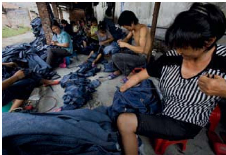
↑ A Xintang, un atelier de couture sous un abri de fortune.

Si ceux-ci restent à Xintang, ce n'est pas parce qu'ils y gagnent bien leur vie, mais parce qu'ils sont un peu coincés. En effet, la confection se situe au milieu de la chaîne de production de l'industrie du jean. Quand ces petits chefs d'entreprise achètent le tissu ou les articles de mercerie, il leur faut payer la totalité de la commande.