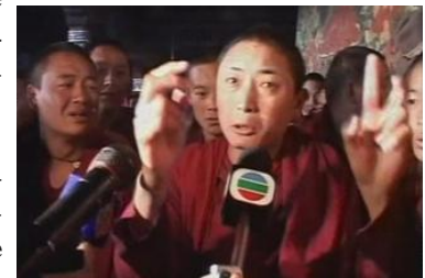
Un moine tibétain interviewé le 27 mars à Lhasa.

L'objectif est double. Il s'agit d'abord d'accréditer la version que les émeutes du vendredi 14 mars à Lhasa se sont résumées à un déchaînement de violence de type ethnique de la part des manifestants tibétains contre les immigrés han (principale ethnie de la Chine) et hui (minorité musulmane) ; en présentant les choses sous cet angle, Pékin veut contrer les accusations de "répression" lancées par l'entourage du dalai-lama et relayées par les médias occidentaux. Ensuite, Pékin accuse les médias occidentaux d'avoir manipulé les photos ou les films afin d'attiser l'indignation.