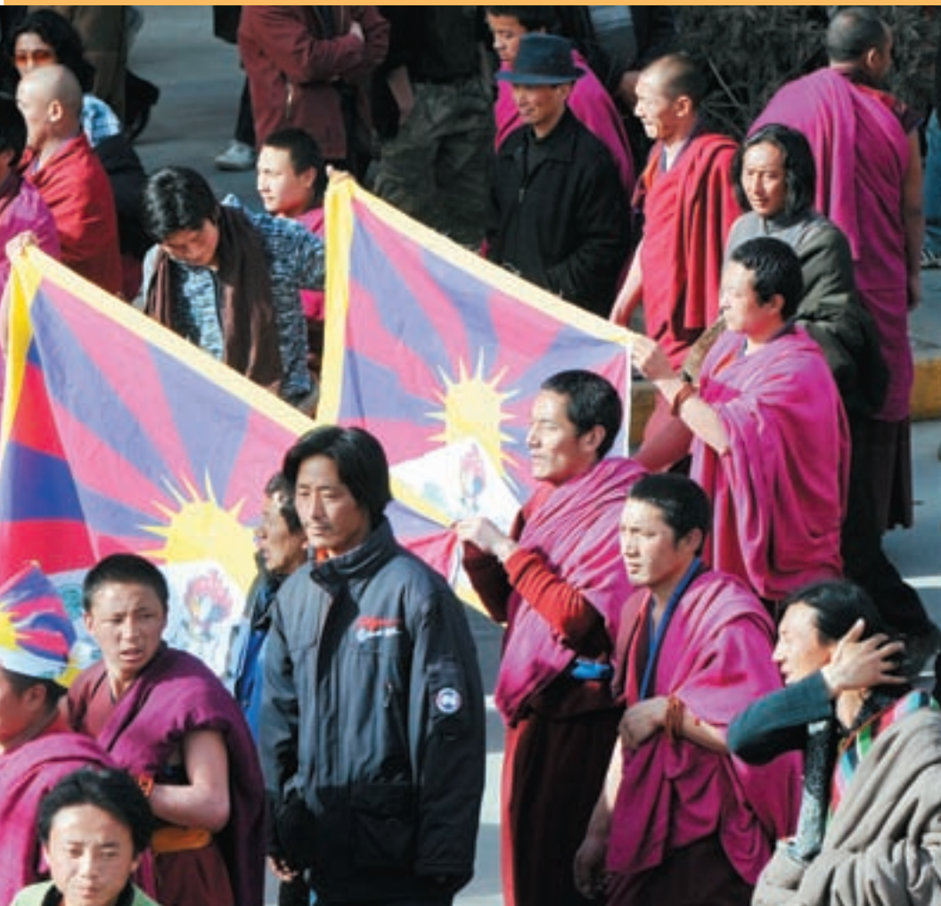
▲ Moines défilant à Xiahe, dans la zone tibétaine incluse dans la province chinoise du Gansu, le 14 mars.