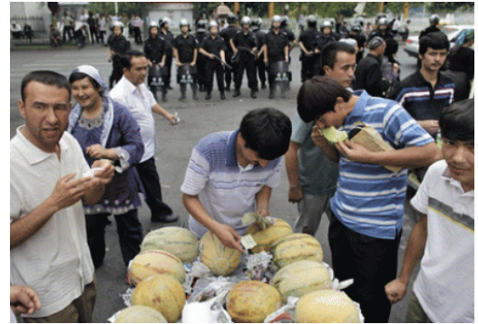
Des Ouïghours choisissent des melons alors que les forces de police se tiennent en rang serrés à quelques mètres, marché d'Urumqi, 10 juillet 2009.